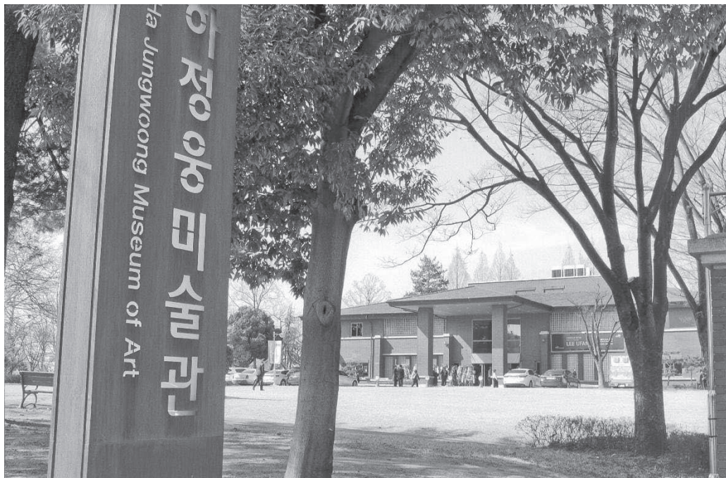
光州市立美術館 河正雄美術館