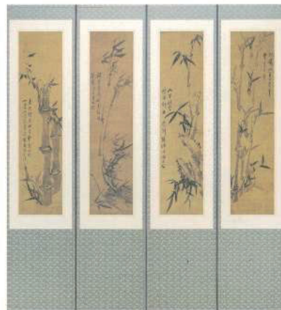
秋史 金正喜 チュサキム・ジョンヒ、《四時墨竹図四幅屏》 ca.1840s、紙に墨、四曲屏風、206.5x205cm