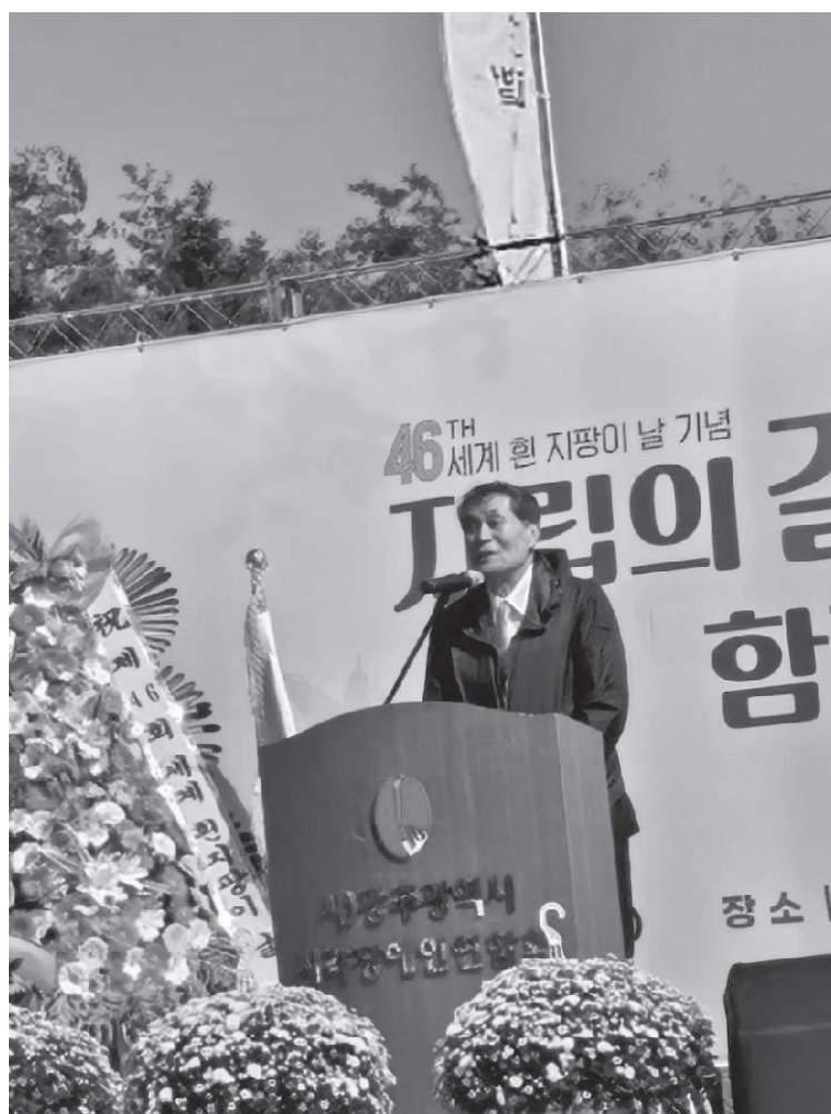
東江・河正雄賞授与式で祝辞（2025. 10. 28）