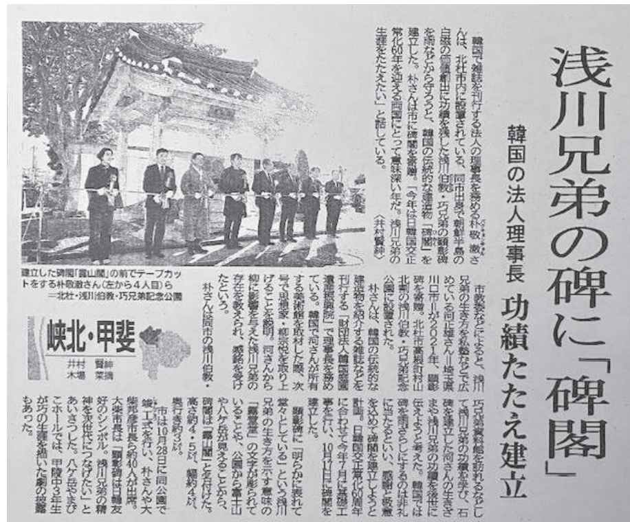
山梨日日新聞(2025. 10. 28)

『碑閣・露山閣』が浅川兄弟の国際親善の光を輝かせ、日韓友好交流の真心が実っていくことを永遠に祈念し祝辞と致します。