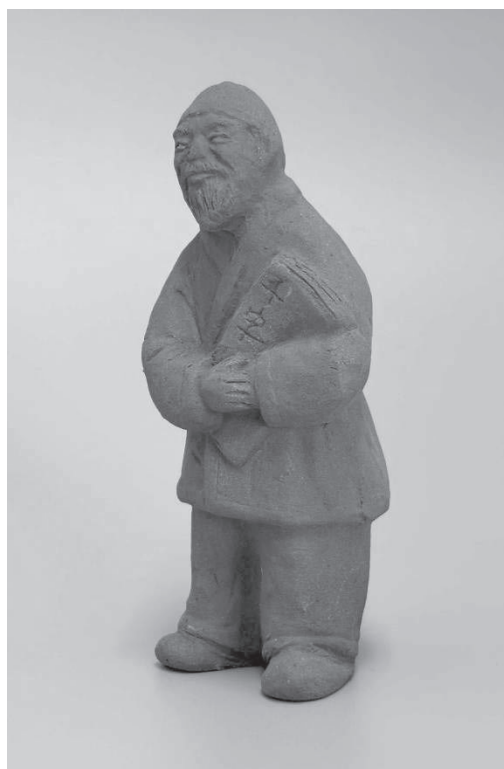
王仁賞牌（上）と副賞王仁像・テラコッタ