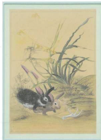
チェ・ヘリ、《兎の角》 2018、絹にカラーおよび墨、顔料、彩色木材、79.5x58cm