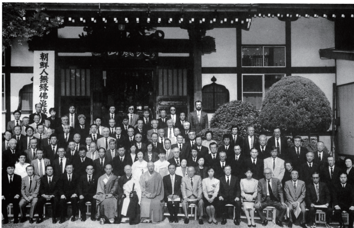
朝鮮人無縁仏 追悼慰霊祭 於 田沢寺 平成2年9月23日