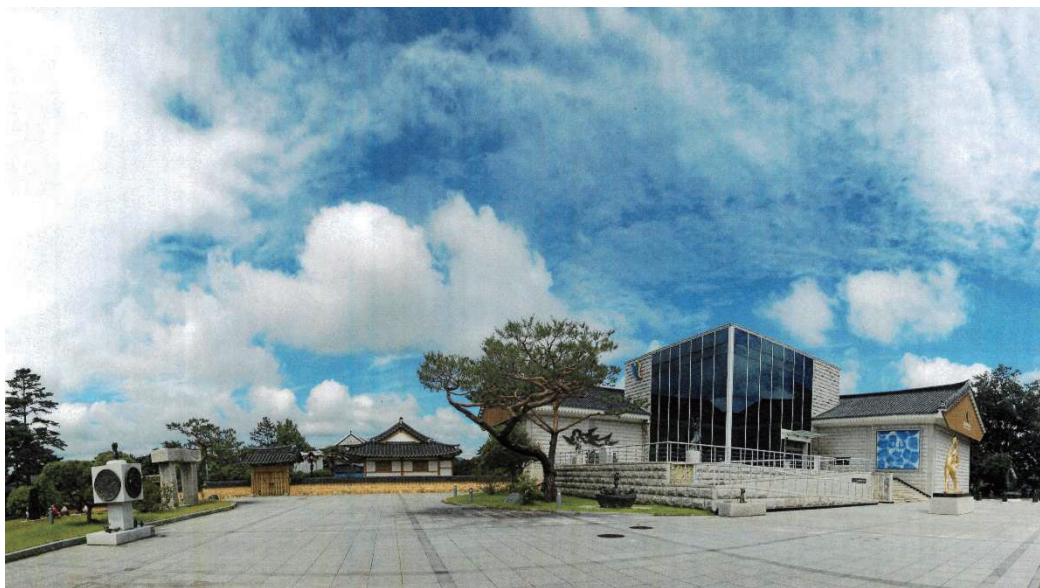
韓屋文化ビエンナーレが開かれる霊岩郡立河正雄美術館