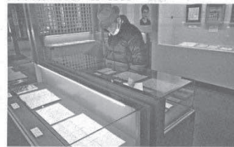
新潮社記念文学館で開催されている企画展

午前9時～午後5時(12月から4時半)。入館は閉館の30分前まで。月曜と12月28日～来年1月5日は休館。高校生以上500円、小中学生300円、仙北市民は無料。問い合わせは新潮社記念文学館 ☎0187・43・3333